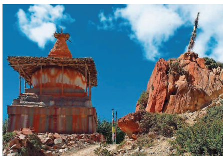
Das Leben der Menschen ist von einem tiefen buddhistischen Glauben, hier eine Chörte, geprägt.