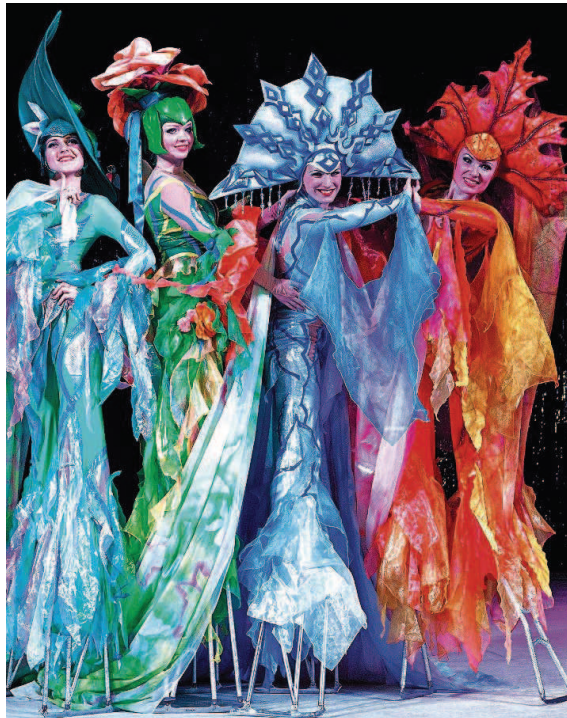
Der „Moscow Circus on Ice“ entwickelt sich seit 50 Jahren stets weiter.

>> Tel. (0 68 61) 9 36 70 www.villa-fuchs.de