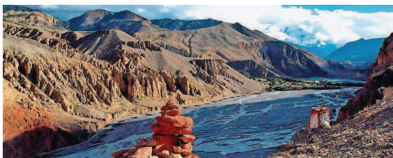
Das Königreich Mustang hat neben seiner Kultur auch landschaftlich viel zu bieten.

>> Tel. (0 68 49) 90 90 www.bildungszentrum-kirkel.de/kultur-im-bzk