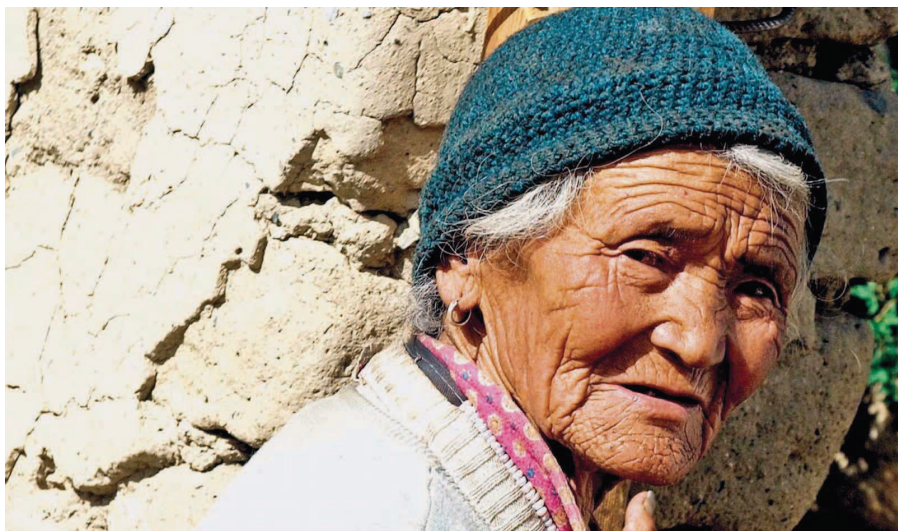
In dem Gesicht dieser Frau spiegelt sich das schwierige Leben der Menschen in den Höhen der Gebirgszüge im Himalaya wider. Über das Leben in dem von 8000 Meter hohen Bergen umgebenen Dorf berichten die Hessenauer in Kirkel.

Karten für die Veranstaltung von Jenny Inc. Theater in Zusammenarbeit mit der Neunkircher Kulturgesellschaft zum Preis von 29,95 Euro bei allen Vorverkaufsstellen von Ticket Regional, Tickethotline (06 51) 9 79 07 77 und unter: www.nk-kultur.de/halbz. red