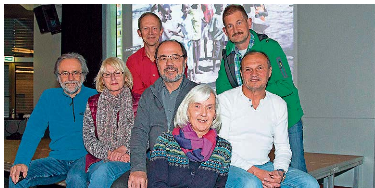
Die Freunde des Abenteuer museums Rox-Schulz wollen die Erinnerung an den Globetrotter bewahren.

Verständnis vom Reisen weitertragen. „Unsere Botschaft ist, abseits der ausgetretenen Touristenpfade verschiedene Länder zu bereisen und den