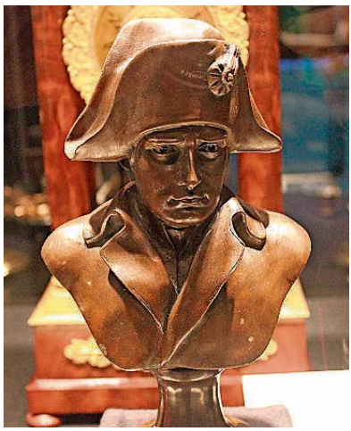
Diese Büste des einstigen Kaisers der Franzosen können Besucher in Metz sehen.